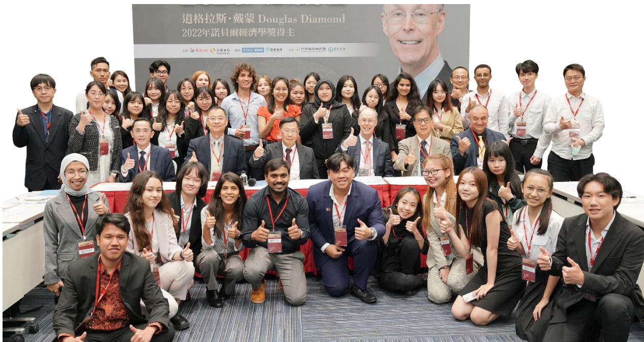
圖：禮聘多位國際級大師蒞校講學，師生可親自向大師請益!每年定期邀請諾貝爾得獎者舉辦大師論壇。