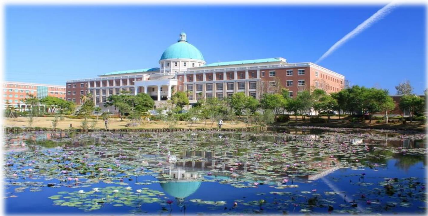
圖：就讀亞大，就是就讀一所「綜合大學」+「醫學大學」+「國際大學」