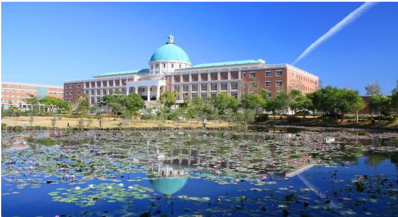
圖：就讀亞大，宛如就讀一所「綜合大學」+「醫學大學」+「國際大學」