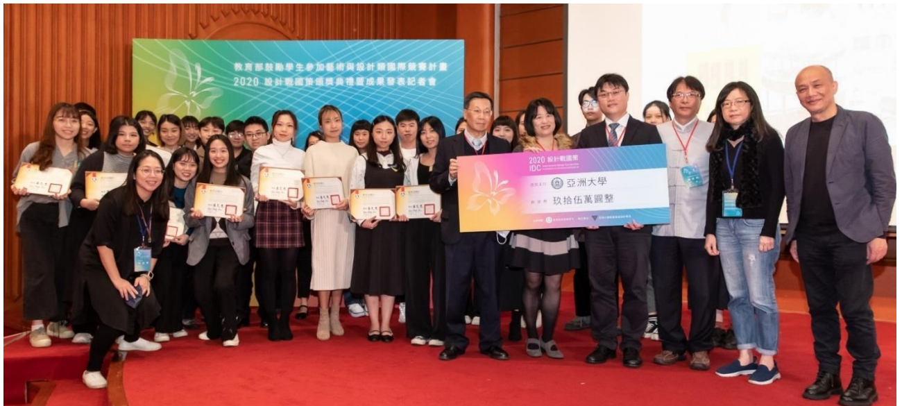
圖：亞洲大學獲國際設計競賽 7 年高教第一！