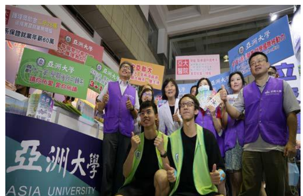
(圖：招生處行政團隊參加大學博覽會)

校址：台中市霧峰區柳豐路 500 號 招生諮詢專線：04-23323456#3132~3135 網址： http://rd.asia.edu.tw