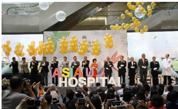
亞洲大學附屬醫院