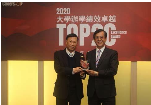
(圖：大學辦學績效 TOP20，全台第 9 名！)